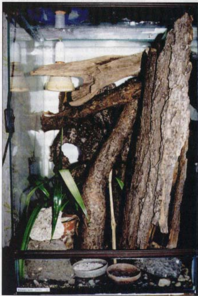
Terárium, v němž došlo k rozmnožení

V září 2002 jsem na burze v České republice zakoupil dva páry Holaspis laevis . Obchodník je prodával pod nějakým vymyšleným nesmyslným druhovým jménem, bohužel si nepamatuji pod jakým. Obchodník nevěděl lokalitu, ale ještěrky byly importovány z Tanzánie. Jednalo se o dospělá zvířata. Parazitologické (koprologické) vyšetření bylo negativní. Doma jsem každý pár umístil do jednoho terária. Během krátké doby jsem jeden pár