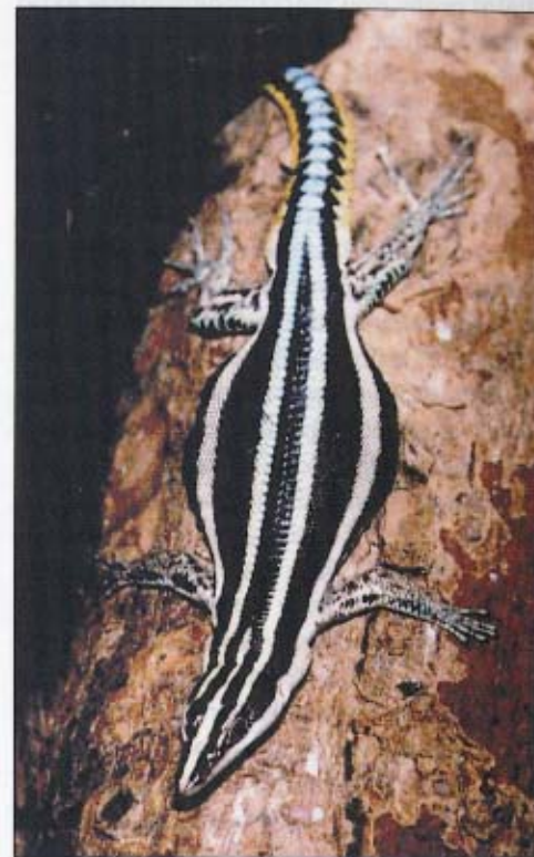
Dospělý jedinec Holaspis laevis

niho a zádového svalstva rozšířit a oploštit tělo, což jim umožní zbrzdění při „doletu“ ze stromu na strom (podobně jako u asijských Draco ). Rovněž tak mohou zvětšit dorzální