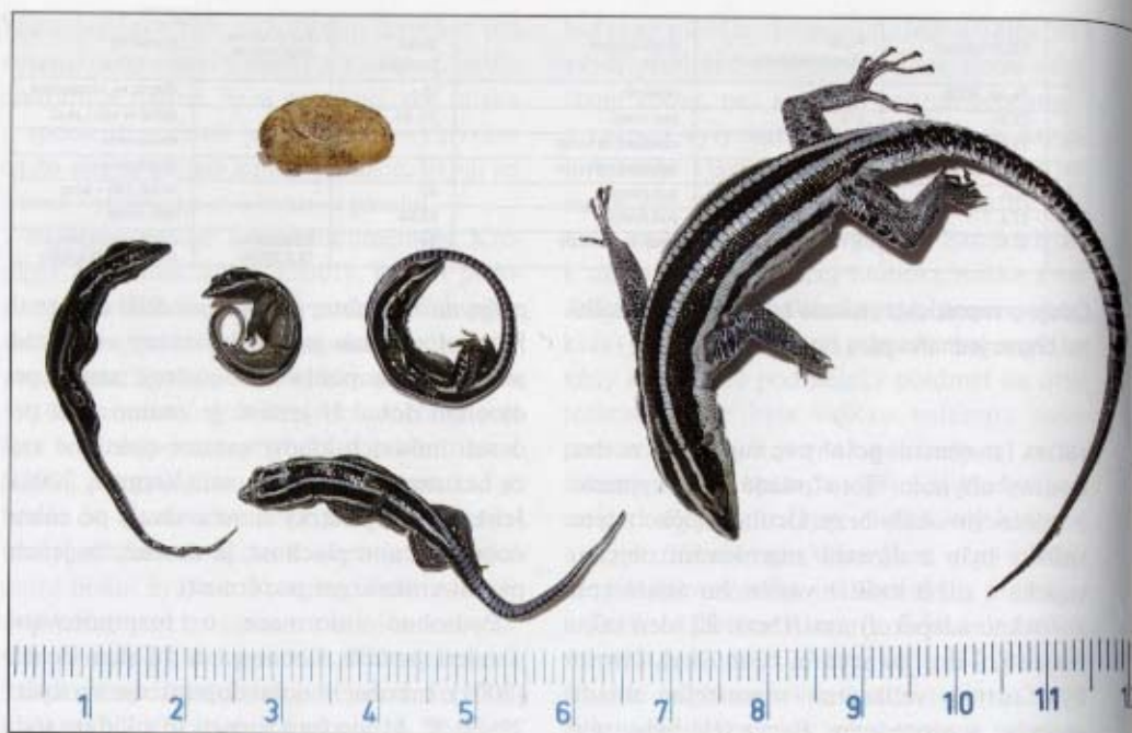
Dospělá samice, mláďata a vaječný obal (konzervované v 70 % etanolu)

chce v teráriu neustále pozorovat temperamentně pobíhající, pěkně vybarvené malé ještěrky s velmi zajímavou biologií. Při dodržení základních požadavků je lze i úspěšně rozmnožovat. Z jejich biologie v přírodě i v zajetí je stále ještě pramálo známo, proto je to vhodný objekt pro vyplnění mezery v chápání nejen africké, ale přírody jako takové.